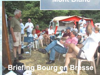
Briefing Bourg en Bresse